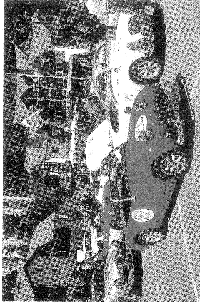
Auto dopo l'arrivo a Passo Mendola nella scorsa edizione. In alto a sinistra Jean Todt

sportiva che la contraddistinguono ormai dal lontano 1957. «Sono felice e fiero di rendermi promotore e testimone di una realtà di simile portata» commenta Ezio Zermiani, che ricorda quanto simili iniziative «culminino nella direzione del-